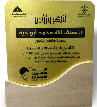
تكريم الجمعية من إمارة منطقة جازان