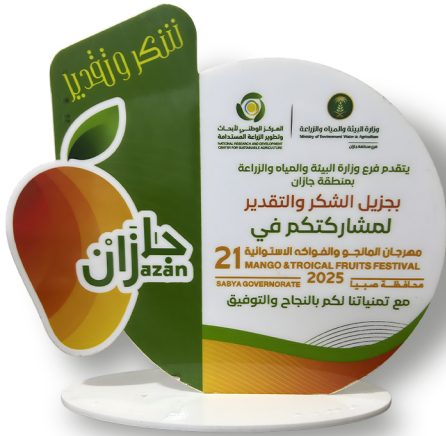
تكريم الجمعية من وزارة البيئة والمياه والزراعة