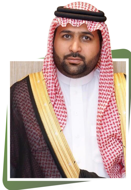
أمير منطقة جازان