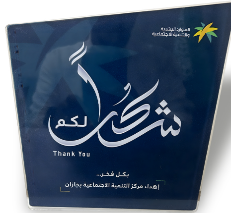
تكريم الجمعية من الموارد البشرية والتنمية الاجتماعية