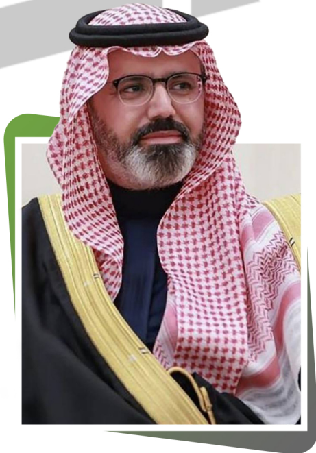
نائب أمير منطقة جازان